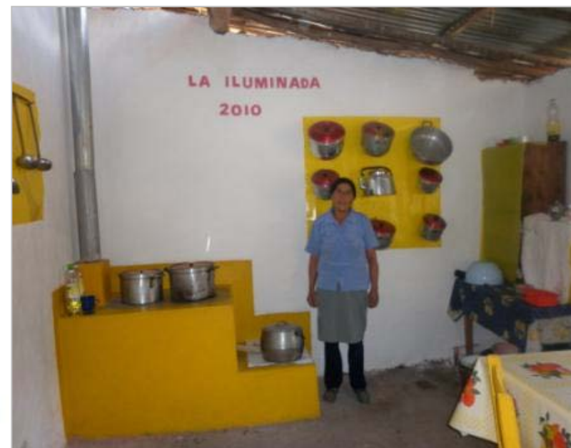
Caserío de Cunguay. Distrito de Santiago de Chuco

En la región La Libertad más de 40,000 hogares andinos de extrema pobreza contarán con cocinas mejoradas certificadas al final del proyecto